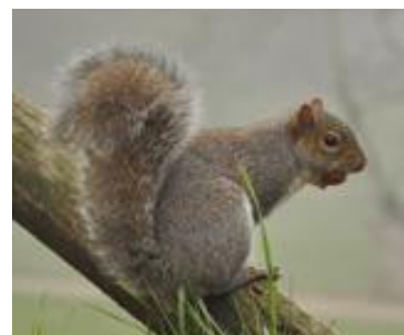
écureuil gris d'Amérique