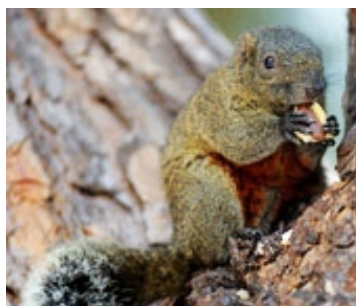
écureuil de Pallas